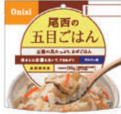
五目ごはん No.S-2101 ¥340+消費税