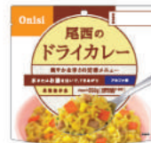
ドライカレー No.S-2110 ¥340+消費税