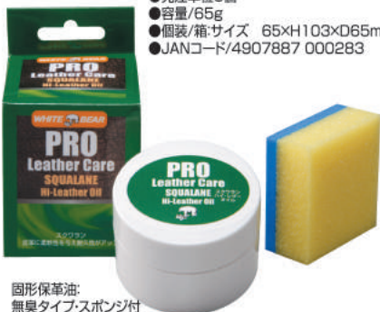
固形保革油: 無臭タイプ・スポンジ付