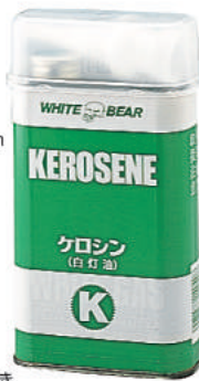
液体燃料:バーナー用 ・キャップ、ジャバラホース付き