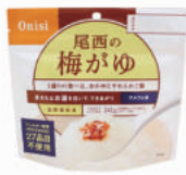
梅がゆ No.S-2108 ¥280+消費税