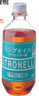
白灯油ランプ専用 燃料オイル