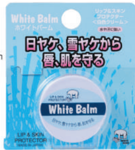
強力日焼け止め: オールシーズン