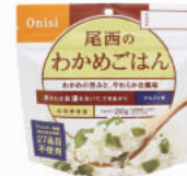
わかめごはん No.S-2104 ¥320+消費税