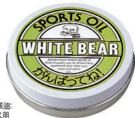
固形保革油: サービス用