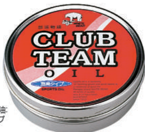
固形保革油: 無臭タイプ