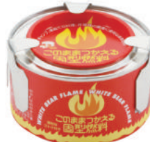
固形アルコール燃料

※データは各条件により異なります。水の沸騰は 気温20℃、水温20℃の状態からスタート。