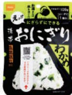
わかめ No.AK2-W30 オープン価格