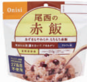
赤飯 No.S-2102 ¥340+消費税