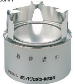
固形アルコール燃料: 火力調節可