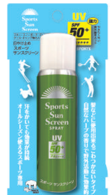
強力日焼け止め: オールシーズンSPF 50+