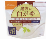
白がゆ No.S-2107 ¥260+消費税