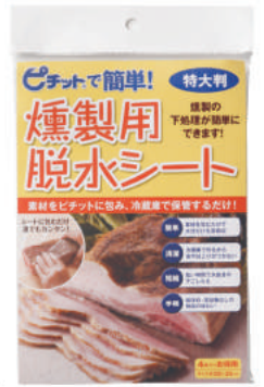
下ごしらえ用脱水シート