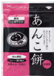
あんこ餅 No.S-761 ¥440+消費税