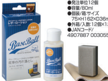
エマルジョンクリーナー: スポンジ、仕上げ布付