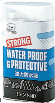
防水剤・帆布用 ・キャップ、ジャバラホース付