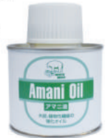
木部・糸強化オイル