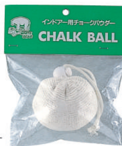
ボール形布袋入り:パウダー