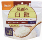
白飯 No.S-2100 ¥280+消費税