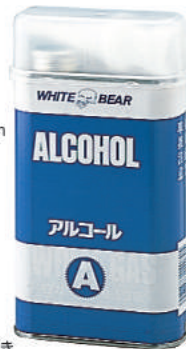
液体燃料:バーナー用 ・キャップ、ジャバラホース付き