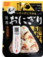
五目おこわ No.AK2-G30 オープン価格