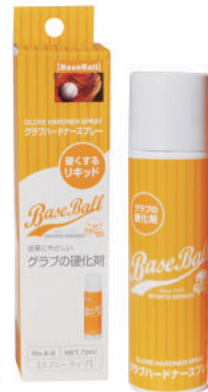
クラブ硬化剤(天然皮革用): エアゾールタイプ