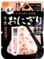
鮭 No.AK2-S30 オープン価格