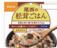
松茸ごはん No.S-2114 ¥400+消費税