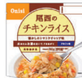
チキンライス No.S-2111 ¥340+消費税