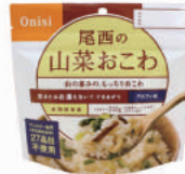
山菜おこわ No.S-2103 ¥380+消費税