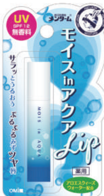
日焼け止めリップ: オールシーズンSPF 12