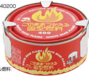
固形アルコール燃料: 火力調節可