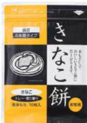
きなこ餅 No.S-760 ¥440+消費税