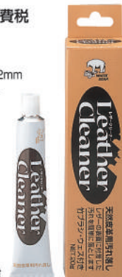
ブラシ、仕上げ布付