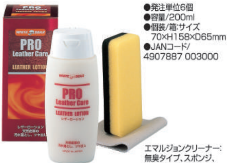
エマルジョンクリーナー: 無臭タイプ、スポンジ、 仕上げ布付