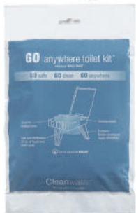
1パックで約907gの排泄物を凝固処理可

凝固剤(消臭剤・触媒 劣化成分配合)、スプ ーン付、スプーン1杯 で約595gの排泄物 を凝固処理可