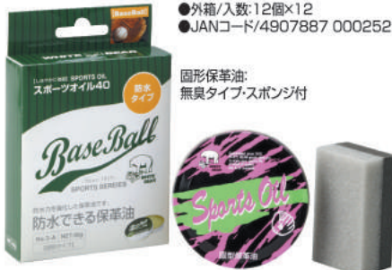
固形保革油: 無臭タイプ・スポンジ付