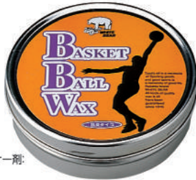
革ボール用、 保革、クリーナー剤: 無臭タイプ