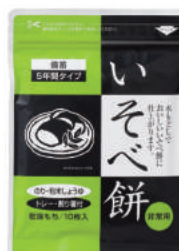
いそべ餅 No.S-762 ¥440+消費税