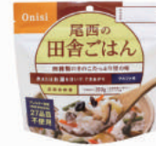
田舎ごはん No.S-2113 ¥340+消費税