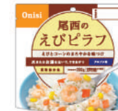
えびピラフ No.S-2112 ¥380+消費税