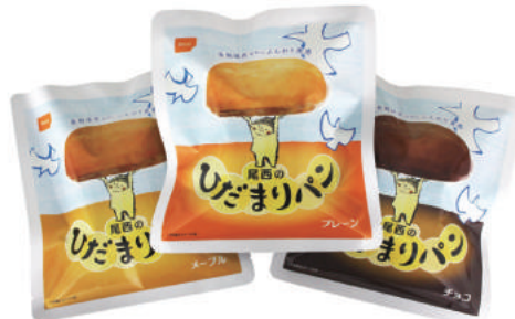
メープル No.S-45M オープン価格